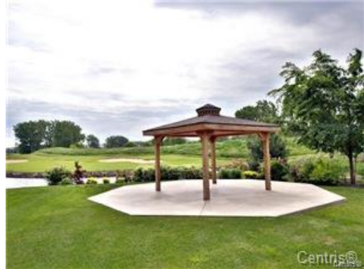
Vue sur l'eau