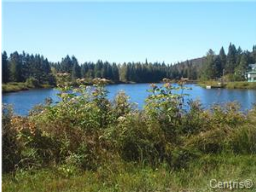
Vue sur l'eau