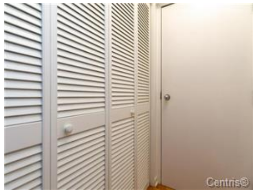
Salle de lavage